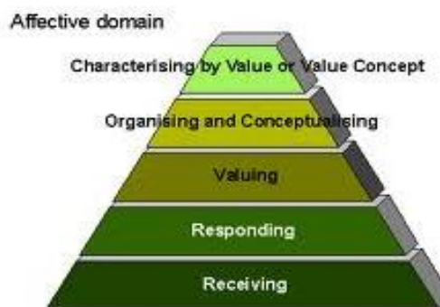
Gambar 1. Affective domain Krathworl (1964:27)

Proses penanaman nilai-nilai karakter siswa menurut Krathwohl, Bloom & Masia (1964) ada 5 tahap, yaitu: (1) Receiving (menyimak); (2) Responding (menanggapi); (3) Valuating (member nilai); (4) Organizing (mengorganisasikan nilai); (5) Characterization (karakteristik nilai), seperti gambar berikut: